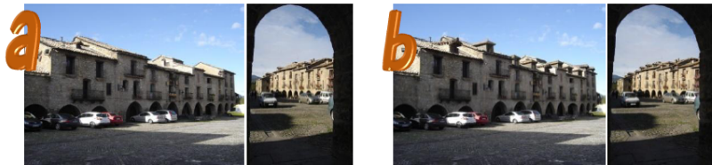
Motivos para la elección de la Opción A